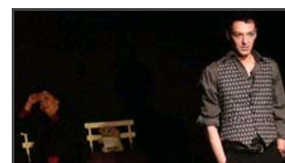
"Aimez-vous la nuit ?" au Guichet Montparnasse