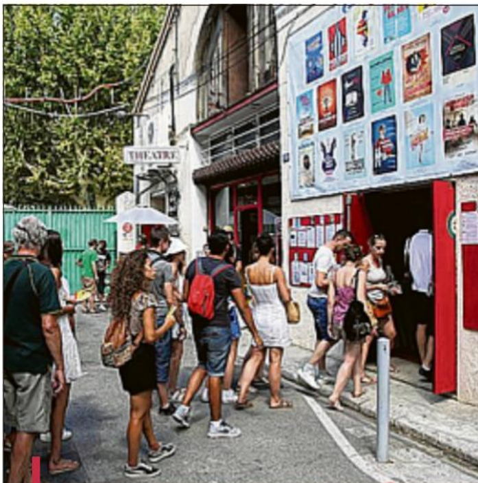
Certains des 140 théâtres du Festival Off vont reprendre du service en juillet, partiellement et différemment.

Du côté des "Scènes d'Avignon", les théâtres historiques, il se prépare des lectures en plein air à différents endroits de la ville. "Il ne faut pas laisser le