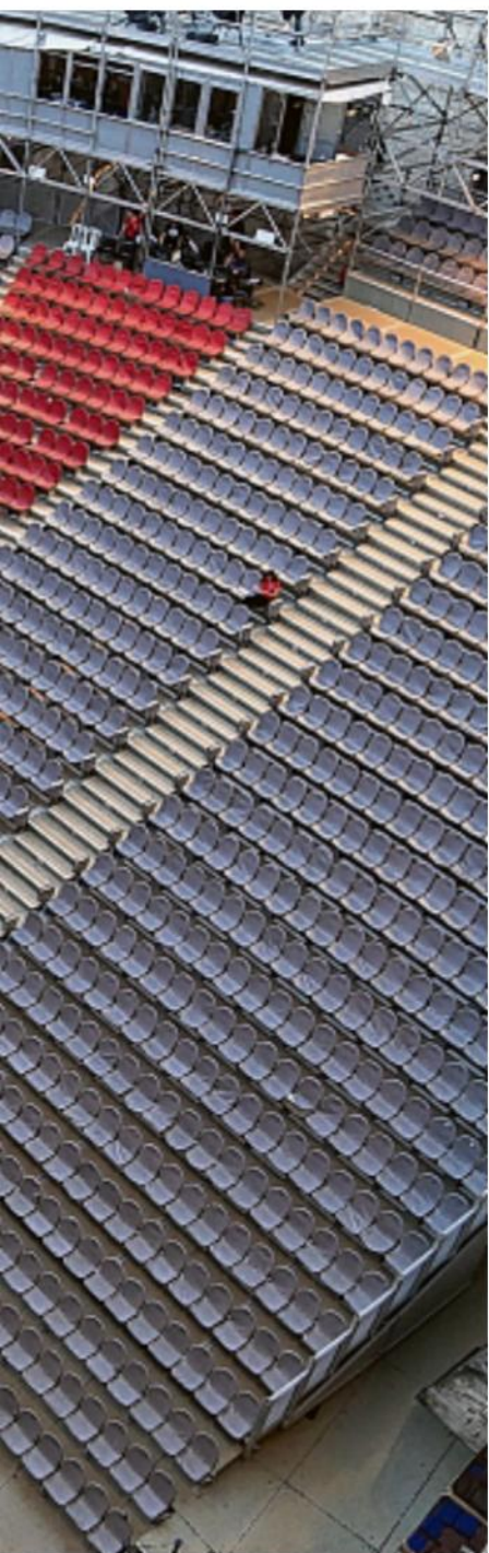
et son public.

Parmi les atouts de La Roque d'Anthéron, outre le plein air plus rassurant que les salles fermées qui peuvent elles aussi désormais ouvrir, il y a une équipe attentive au public et une dévotion de celui-ci aux artistes programmés et au piano roi. Nul doute que la responsabilité de ce public sera sollicitée pour que soient respectées les obligations sanitaires, mais que ne feraient pas les mélomanes pour l'amour de l'art ?